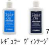
レギュラー ヴァルブオイル 792円