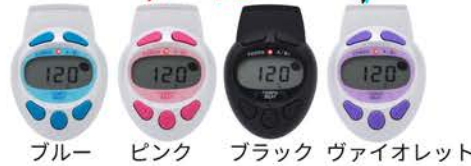
ブルー ピンク ブラック ヴァイオレット