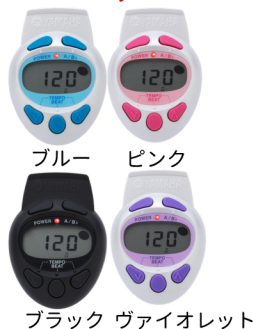
ブルー ピンク ブラック ヴァイオレット